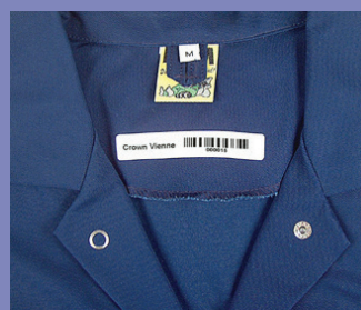
Op het kledingstuk geseald